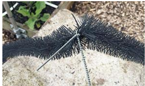
Figuur 8: Een slakkenborstel (Medema).