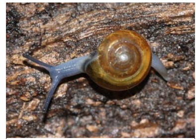
Figuur 4: De lookglansslak ( Oxychilus alliarius ) (warehouse1.indicia.org.uk).