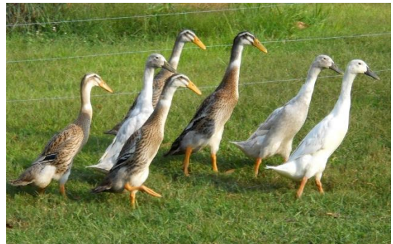
Figuur 3: Indische loopeenden ( Anas platyrhynchos ).