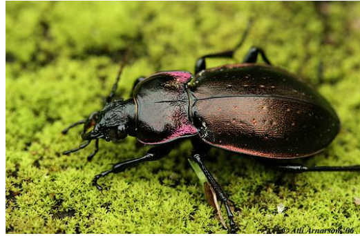
Figuur 2: De tuinloopkever ( Carabus nemoralis ).