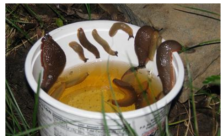
Figuur 5: Bierval met aangetrokken slakken.