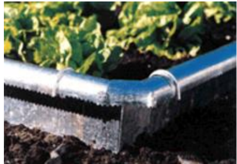
Figuur 7: Een omgekeerde J-vormige barrière (francobelge.ziva.be).