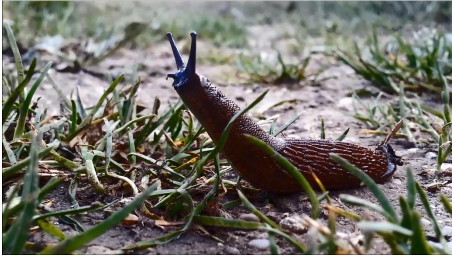
Figuur 1: Spaanse weglak ( Arion lusitanicus ) (youtube.com).

De gewassen op tuinderij Amelis'Hof zijn met name éénjarige planten. Deze planten worden geogst en opnieuw ingezaaid. In de kiemingsfase en de fase van jonge planten zijn deze planten het gevoeligst voor schade door herbivorie.