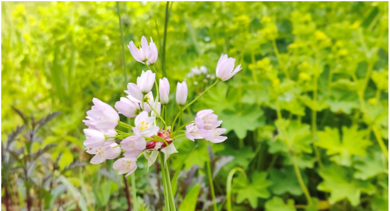
Allium roseum (roze knoflook)

Hier bij De Tuinen van MergenMetz is altijd wat te doen. Het is nooit af. Dat vinden wij niet erg, want wij vinden het leuk. Maar het kost wel geld. En daarom zijn we blij met jullie steun.