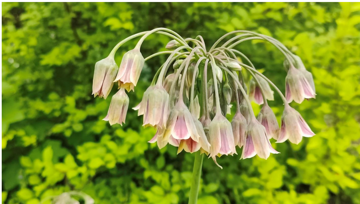
Nectaroscordum siculom (Bulgaarse ui)

Ergens rond juli starten de volgende automatische afschrijvingen. Als je wilt ontvrienden (ook al was je later, bijvoorbeeld november 2022, vriend geworden), klik dan hier en kies (meer naar onder) 'ontvrienden'. Degenen onder jullie die niet voor automatische afschrijving hebben gekozen, ontvangen een factuur.