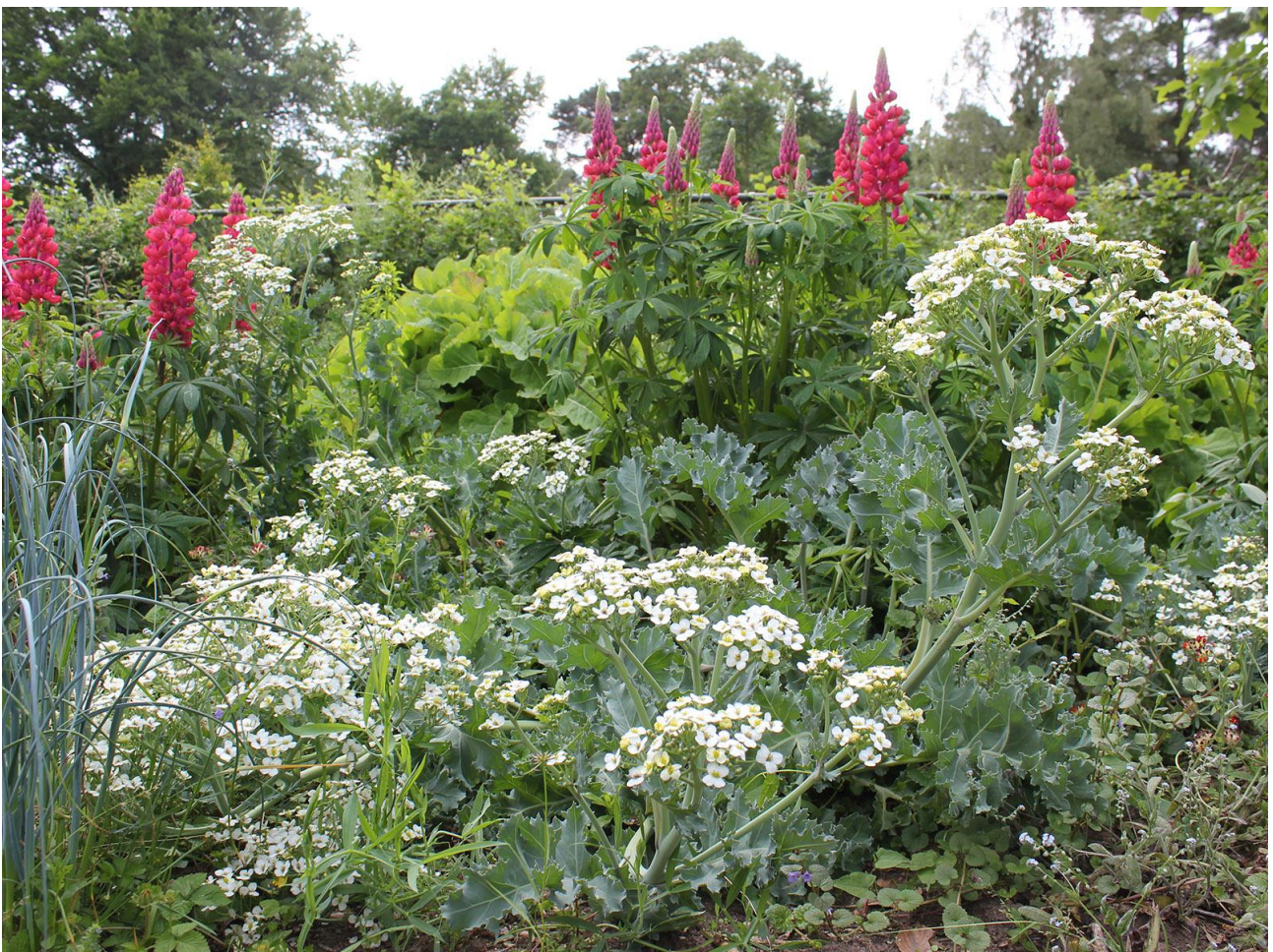
Stukje Eetbare Siertuin met o.a. lupines als nutsplanten (stikstofbinders), bloeiende zeekool, eeuwig moes, alliums

De website kent geen adverteerders of sponsors. Wat wordt gepubliceerd is onafhankelijk en eigen.