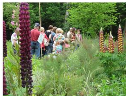
En wat hebben we ermee gedaan?