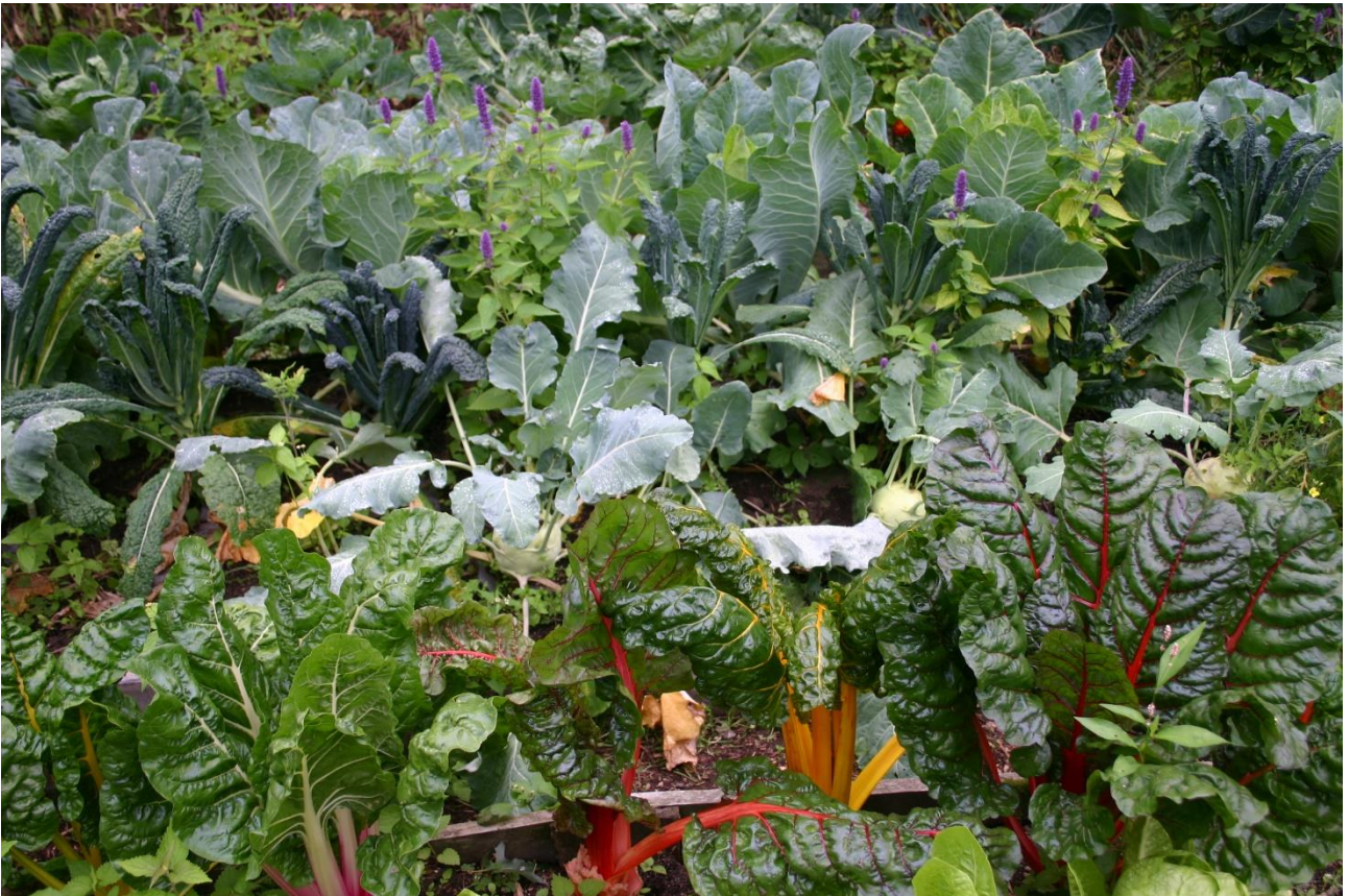
Stukje moestuin met snijbiet, koolrabi, palmkool, Filderkraut en agastache ertussen om vlinders te misleiden

De Tuinen van MergenMetz zijn een prachtig terrein waarop in meerder sferen verschillende typen ecologische tuinen zijn ontwikkeld. Biodiversiteit en met name ‘het behoud van’ speelt een belangrijke rol. De focus ligt met name op de relatie plant-mens, maar er worden ook enkele dieren gehouden. Het gehele terrein meet bijna één hectare (waarop zich ook twee woningen bevinden). De tuinen worden onderhouden door de bewoners, met hulp van enkele vrijwilligers, en zijn in het tuinseizoen wekelijks geopend voor bezoekers.