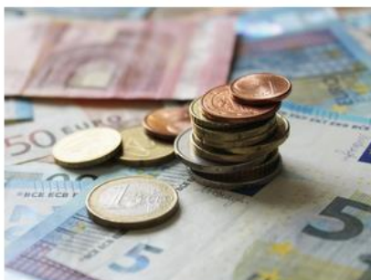
Hoe zit het met het geld?